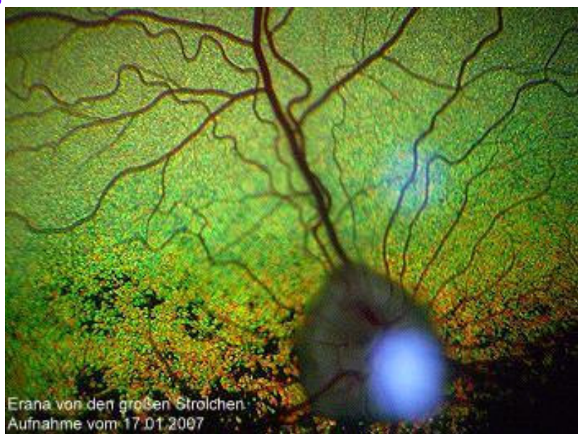
Erana von den großen Strolchen. Aufnahme vom 17.01.2007

Wie schnell entwickelt sich die prcd-PRA?